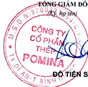
ĐỖ TIẾN SĨ